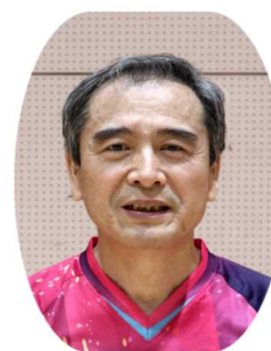
第85回 Sリーグチャンピオン