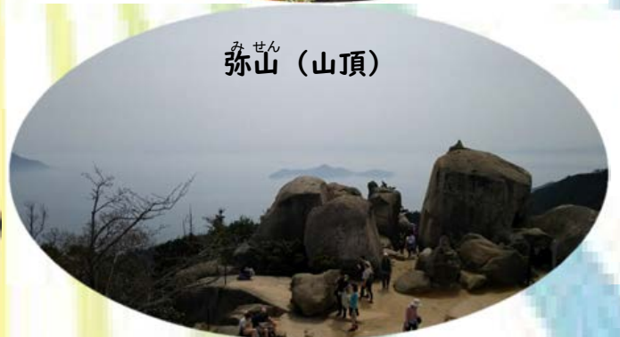
弥山 みせん （山頂）